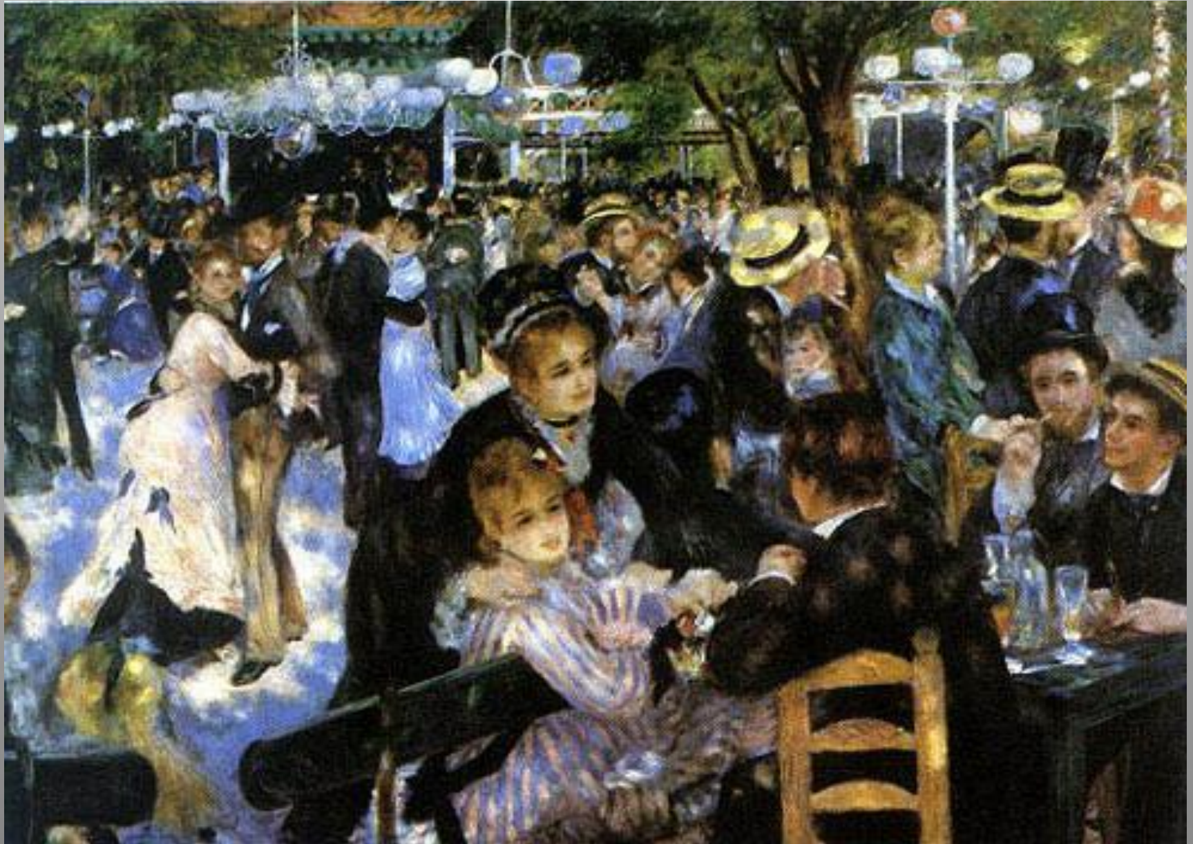
Бал в Мулен де ла Галетт